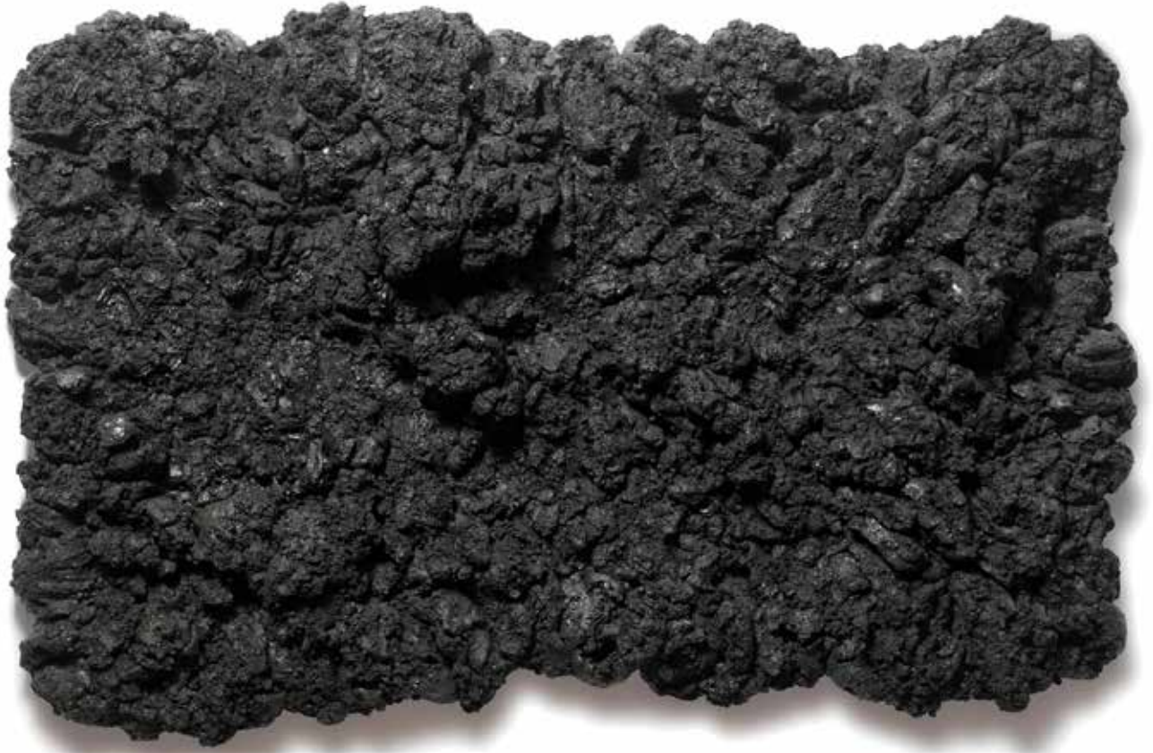
Ohne Titel, Rußschwarz und Leinöl auf Holz 115 x 180 cm, 2008