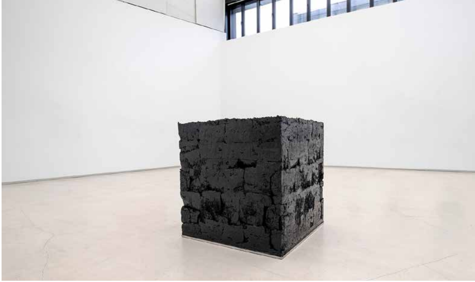
Matthias Lutzeyer, „Ohne Titel“, Kubus aus Eisenoxydschwarz und Rußschwarz und Leinöl auf Stahlwanne 85x85x85cm, 2022