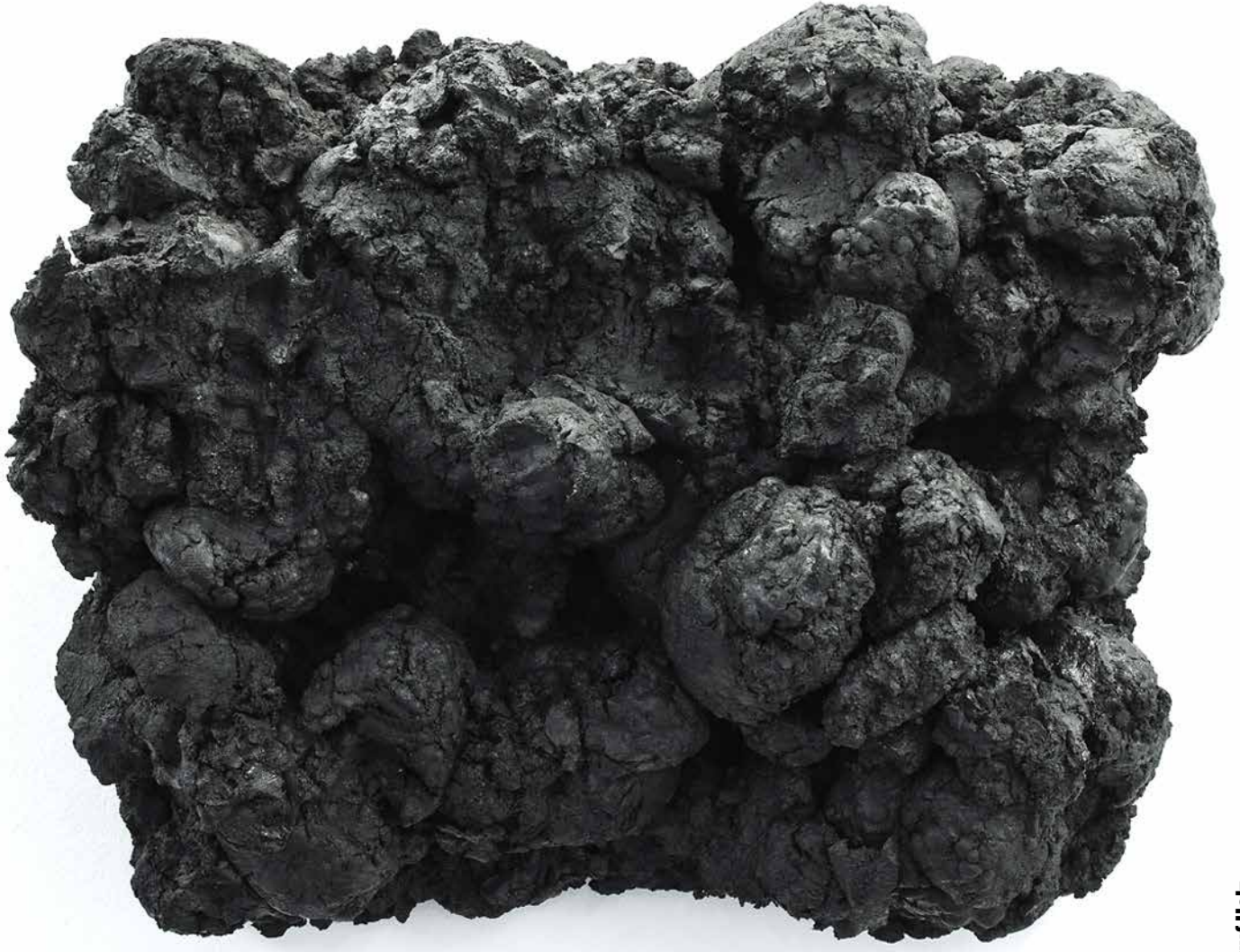
Ohne Titel, Eisenoxidschwarz und Rußschwarz und Leinöl auf Holz 62 x 77 cm, 2011