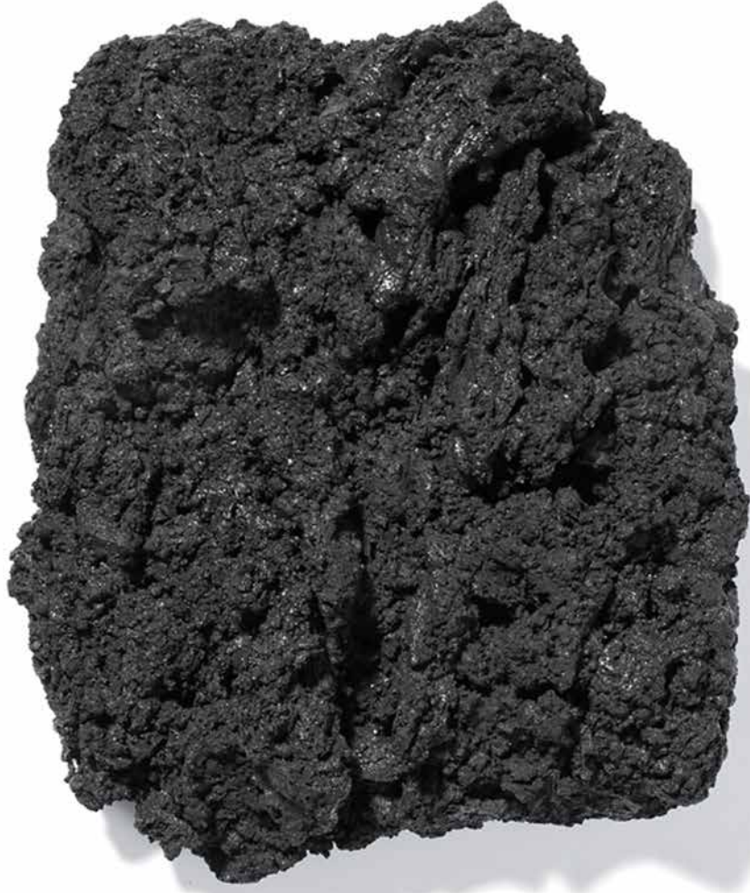
Ohne Titel, Eisenoxidschwarz und Leinöl auf Holz 38 x 22 cm, 2001