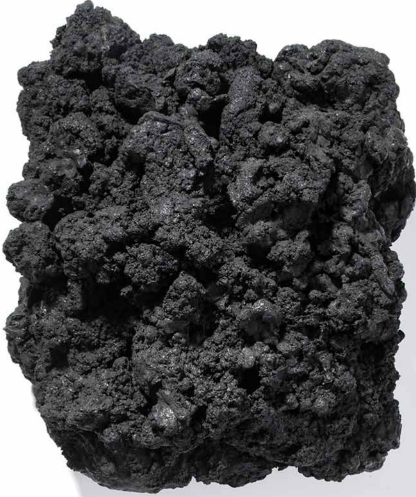
Ohne Titel, Rußschwarz und Leinöl auf Holz 40 x 35 cm, 2008