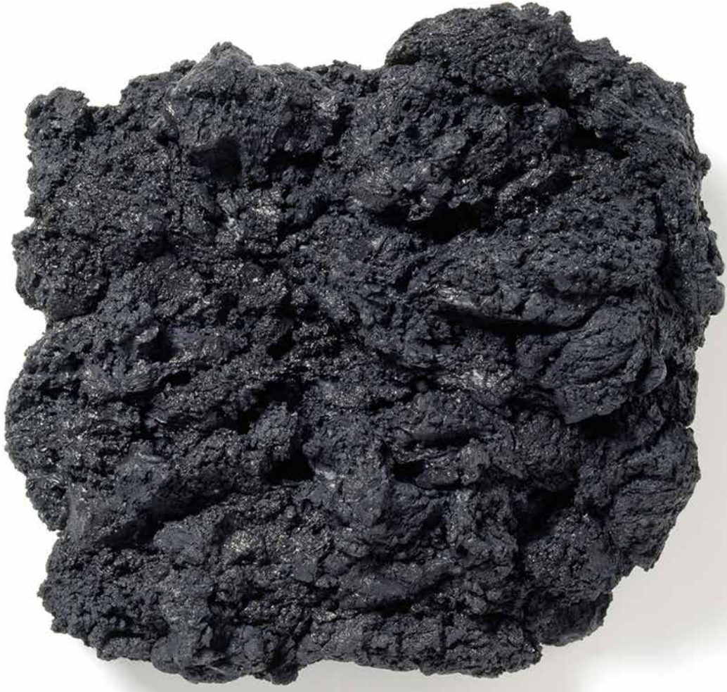
Ohne Titel, Eisenoxyschwarz und Leinöl auf Holz 31 x 35 cm, 2005