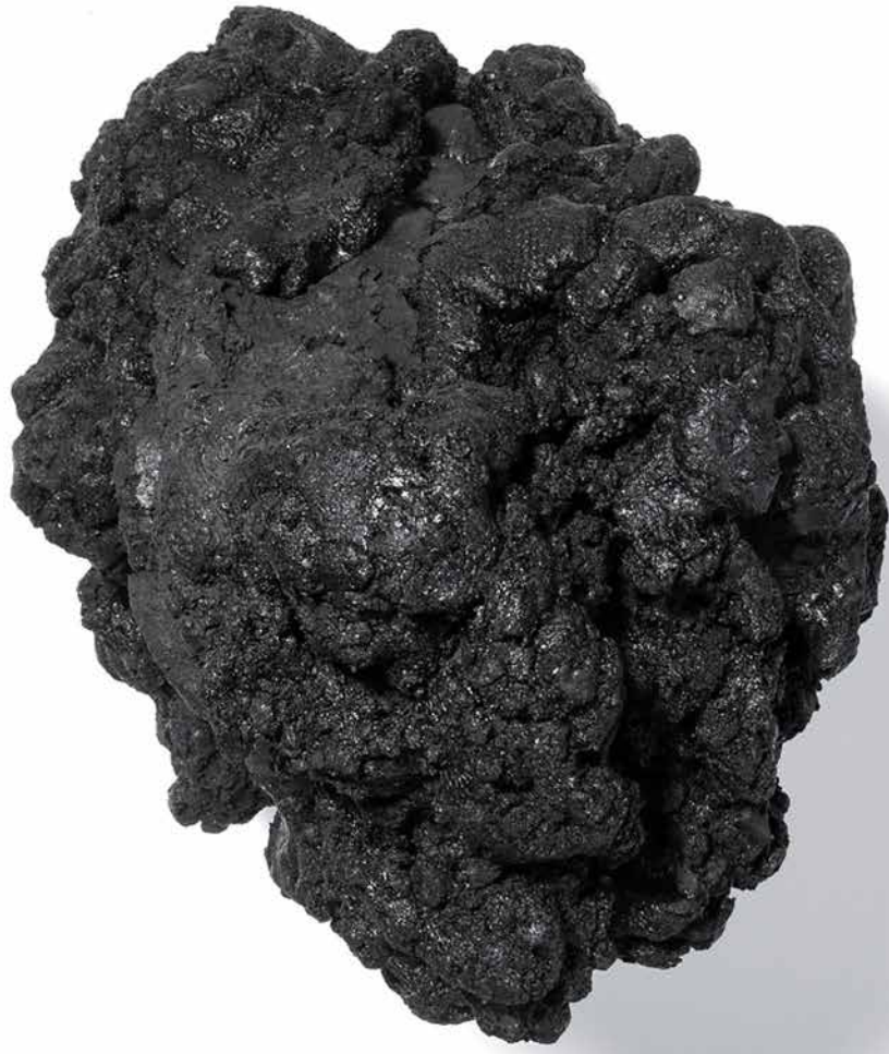
Ohne Titel, Eisenoxidschwarz und Rußschwarz und Leinöl auf Holz 33 x 31 x 39 cm, 2015