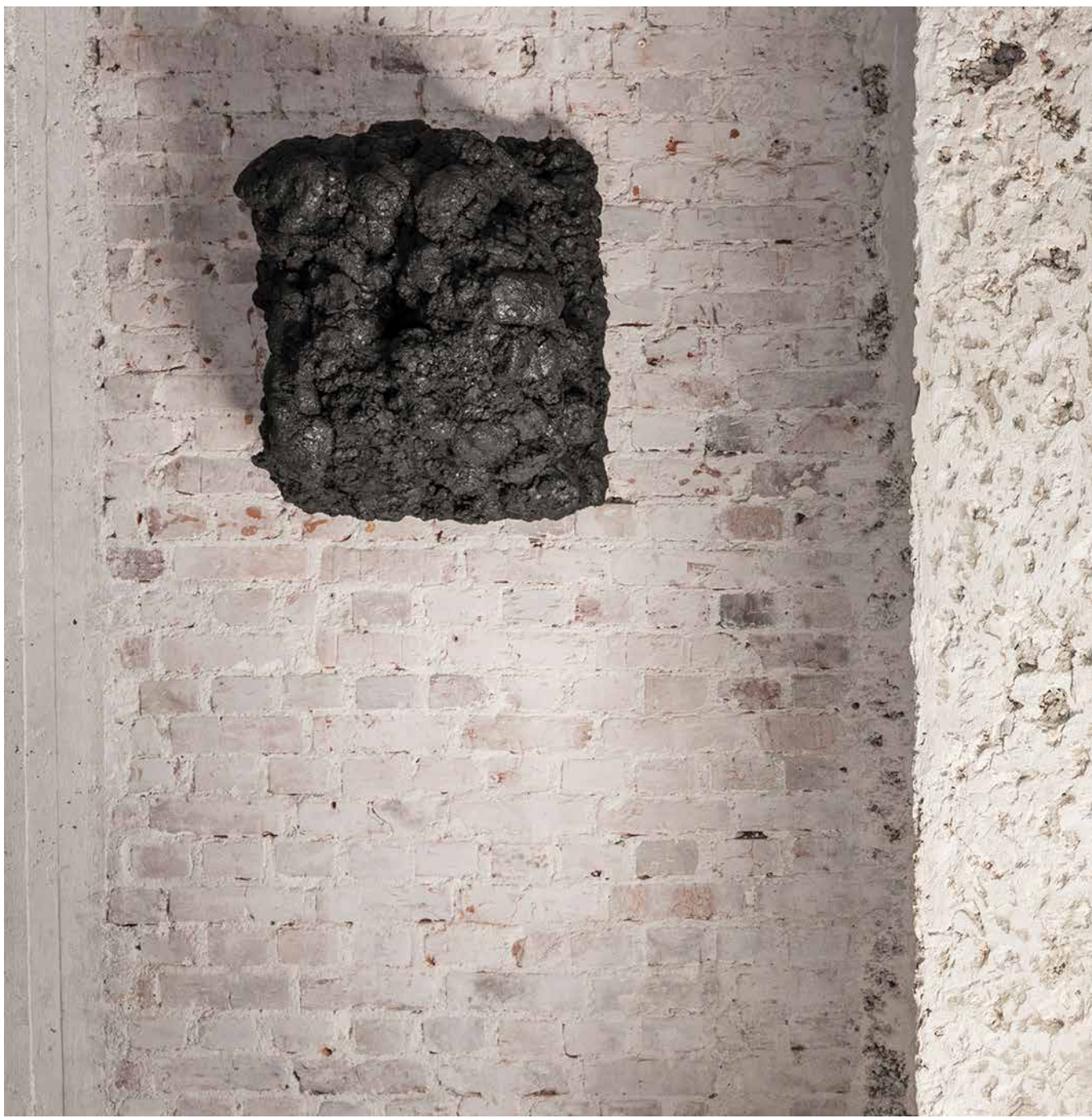
Matthias Lutzeyer Galerie AK2 Stuttgart, 2016