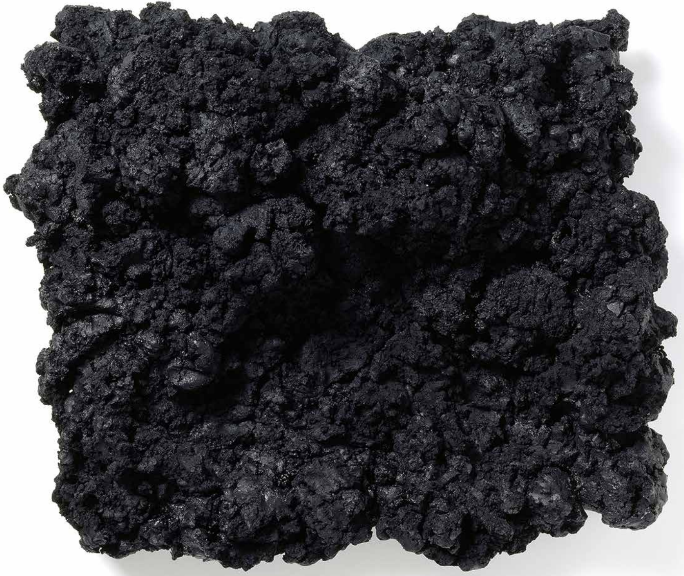
Ohne Titel, Eisenoxidschwarz und Leinöl auf Holz 63 x 73 cm, 2005