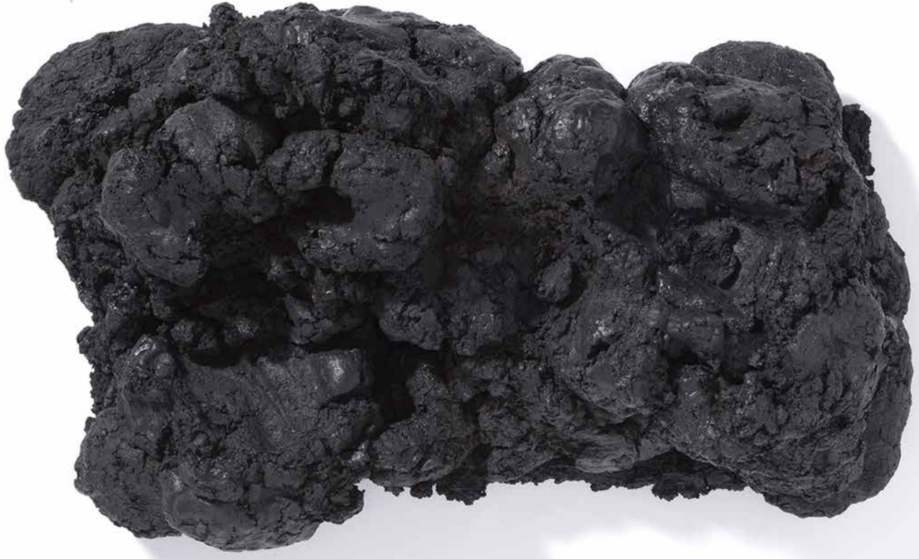
Ohne Titel, Eisenoxidschwarz und Rußschwarz und Leinöl auf Holz 35 x 57 cm, 2011