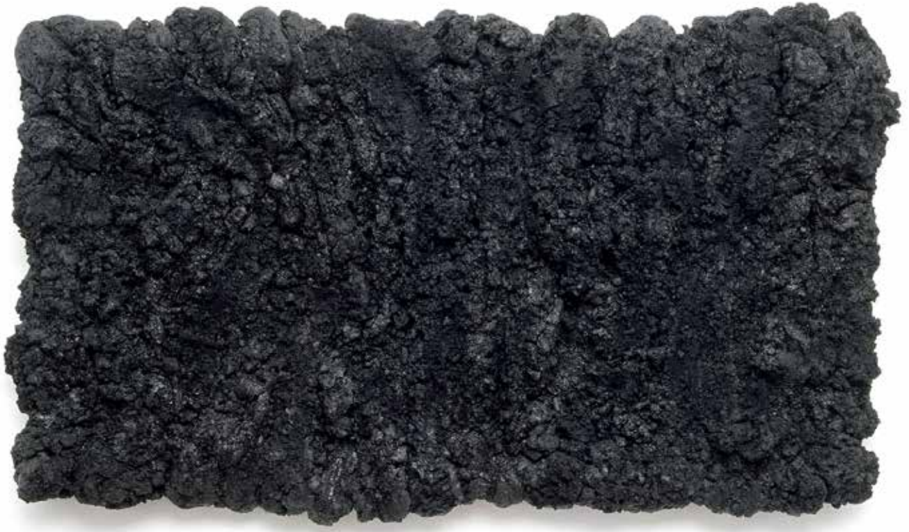
Ohne Titel, Eisenoxidschwarz und Leinöl auf Holz 100 x 180 cm, 2003