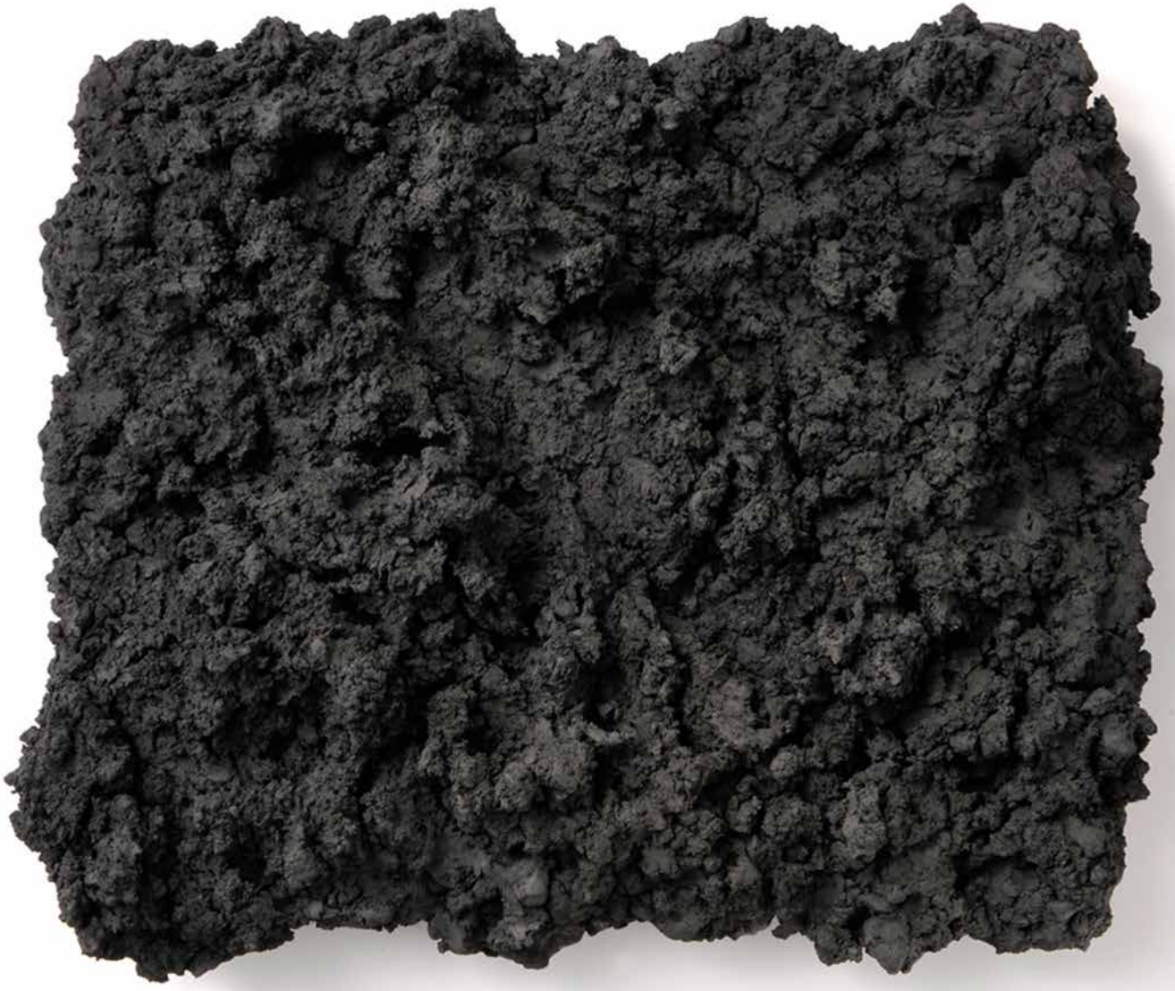
Ohne Titel, Rußschwarz und Öltempera auf Holz 62 x 70 cm, 2005